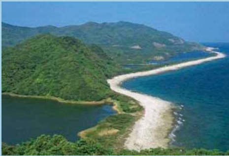
「長目の浜」国の天然記念物