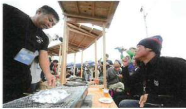
漁師が目の前で調理してくれる 浜焼き島ぐるりは圧巻の迫力!