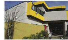
民宿 石原荘 とてもアットホームな雰囲気、島の新鮮な魚料理が自慢のお宿です。