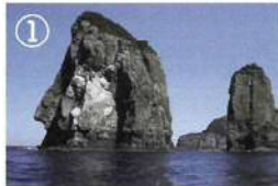
① 断崖クルージング

2日目は各自フリープランとなります。 ※オプションについては予約時にお申し込みをお願いします。