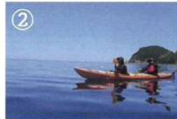
② シーカヤック体験 おひとり様 7,000円