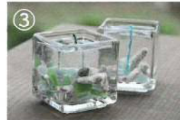
③ ジェルキャンドル作り体験 大人1,800円・小学生1,500円