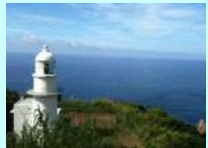
甌島最南端の美しい灯台