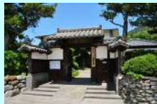
手打集落の入江に沿って、 武家屋敷通りが700mほど続きます