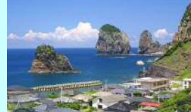
ナボレオン岩を眼前に