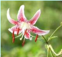
かのこゆりの見頃 7月中旬～8月上旬